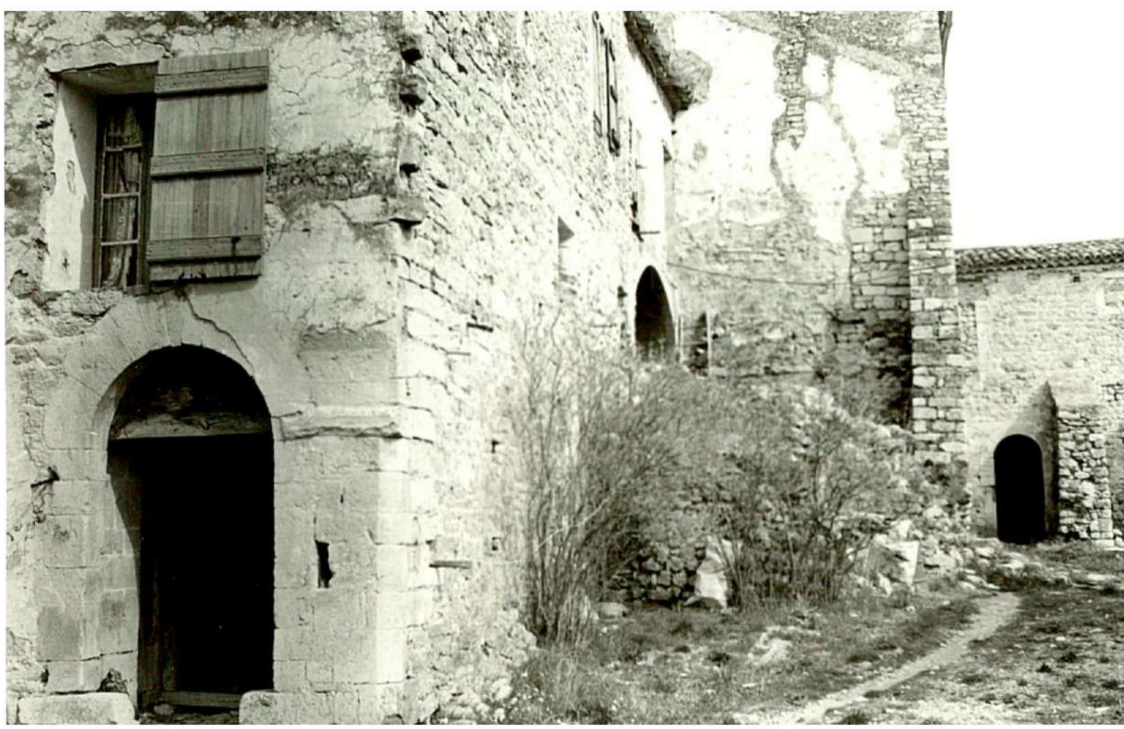
Vue 3 - Ancien four (vers 1978)