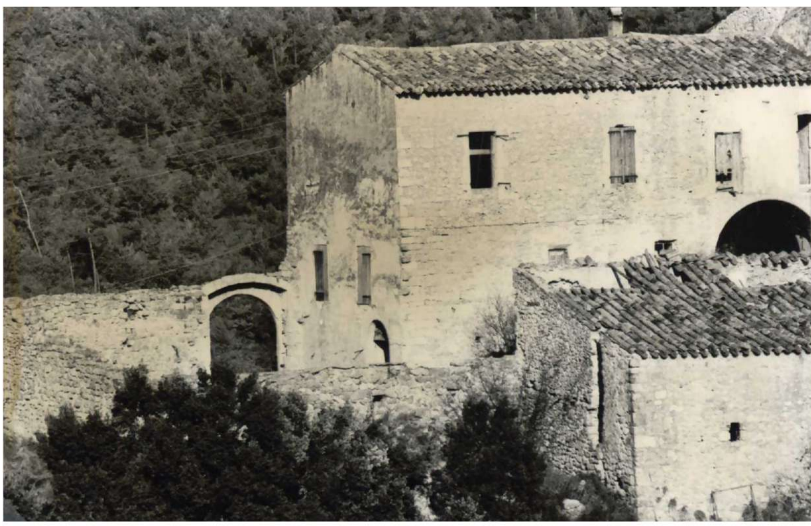
Vue 2 - Ancienne bergerie avant sa ruine (vers 1992)