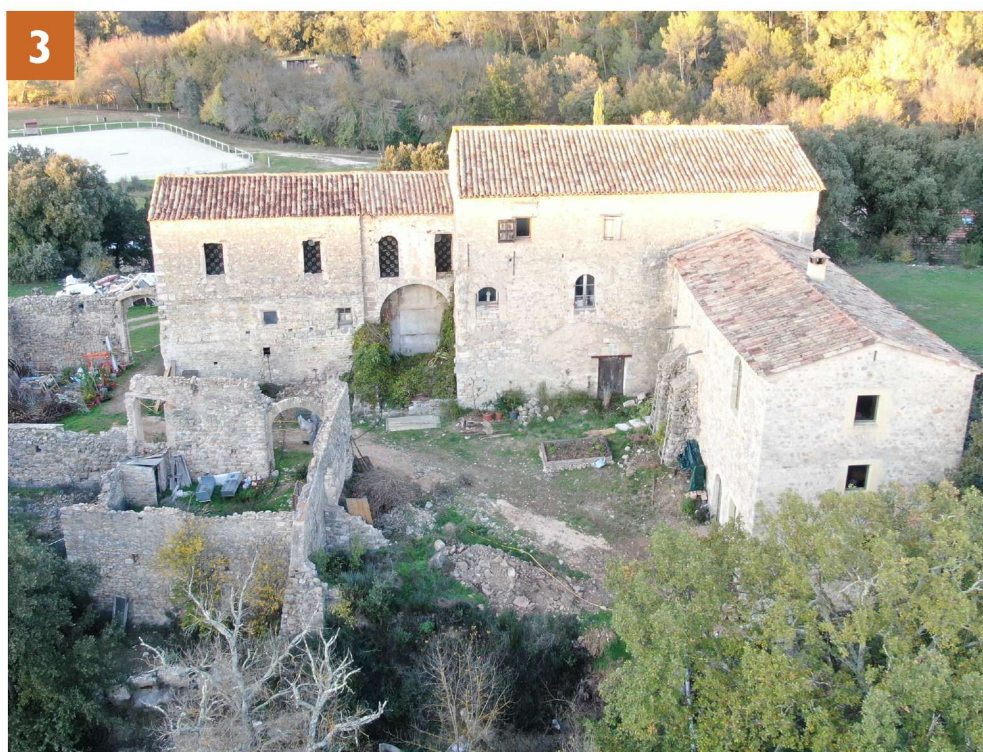
Vue 3 : Sud