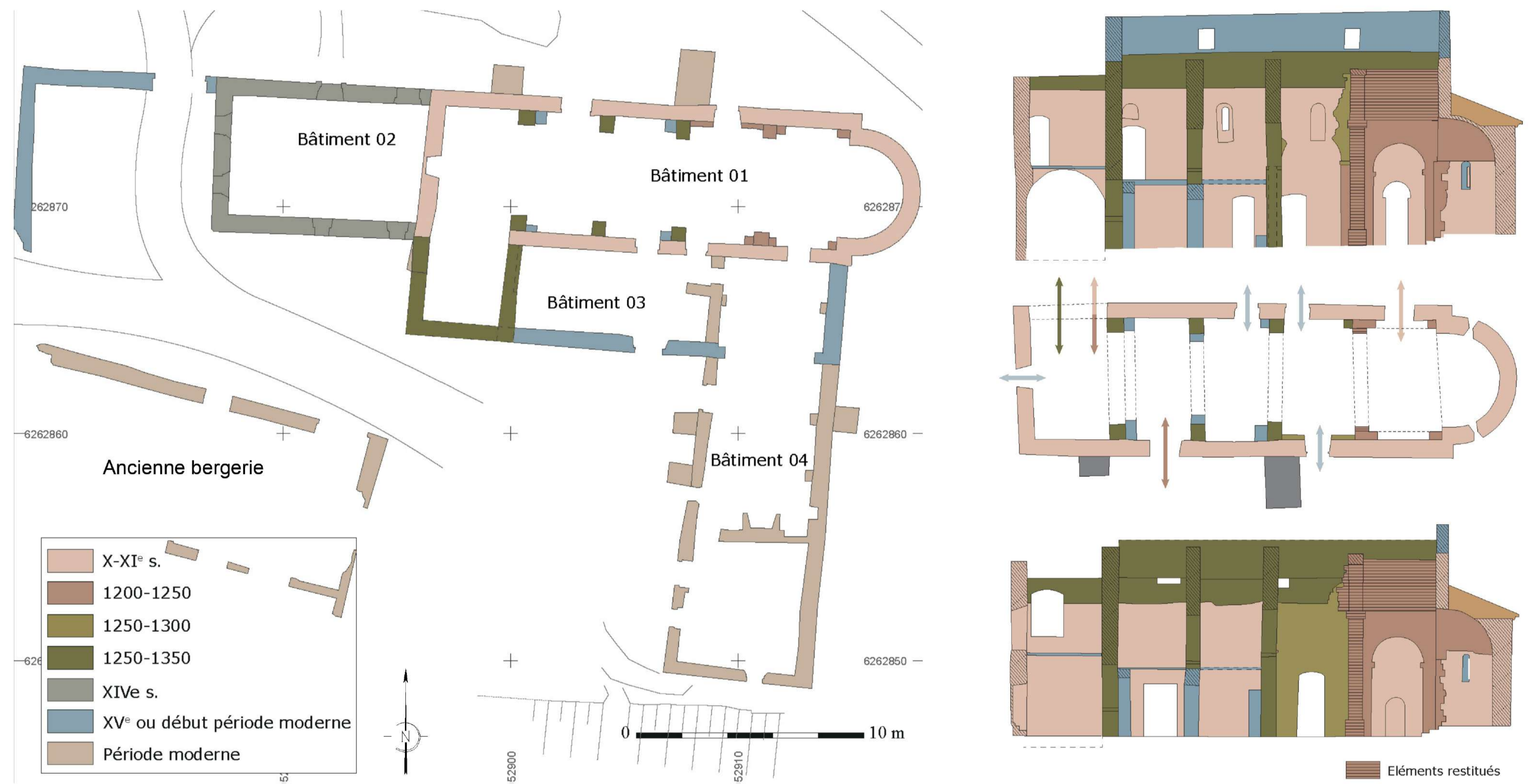
Proposition de datation, extraits de l'étude de M.Riegler - juillet 2023