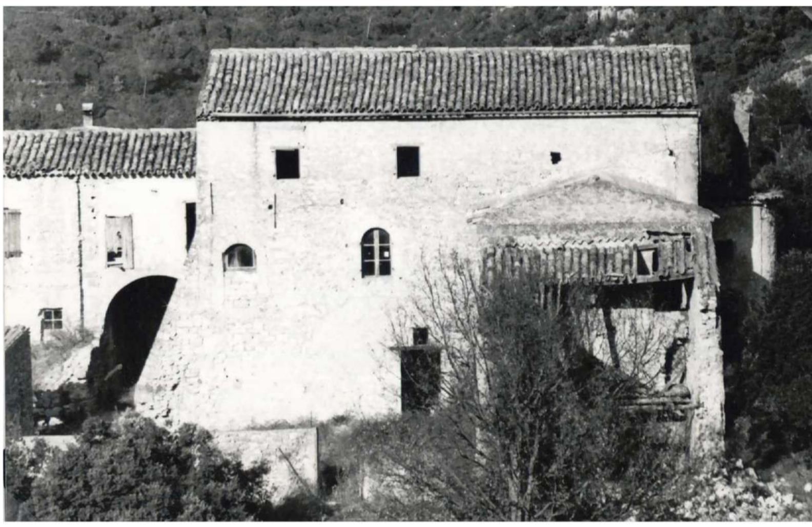
Vue 1 - Aile Sud avant reconstruction (vers 1992)