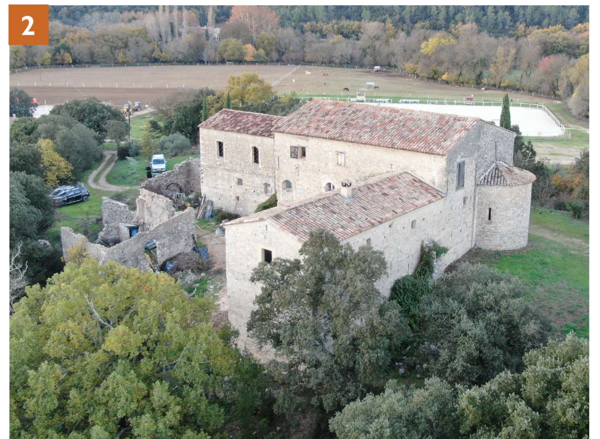
Vue 2 : Angle Sud-Est