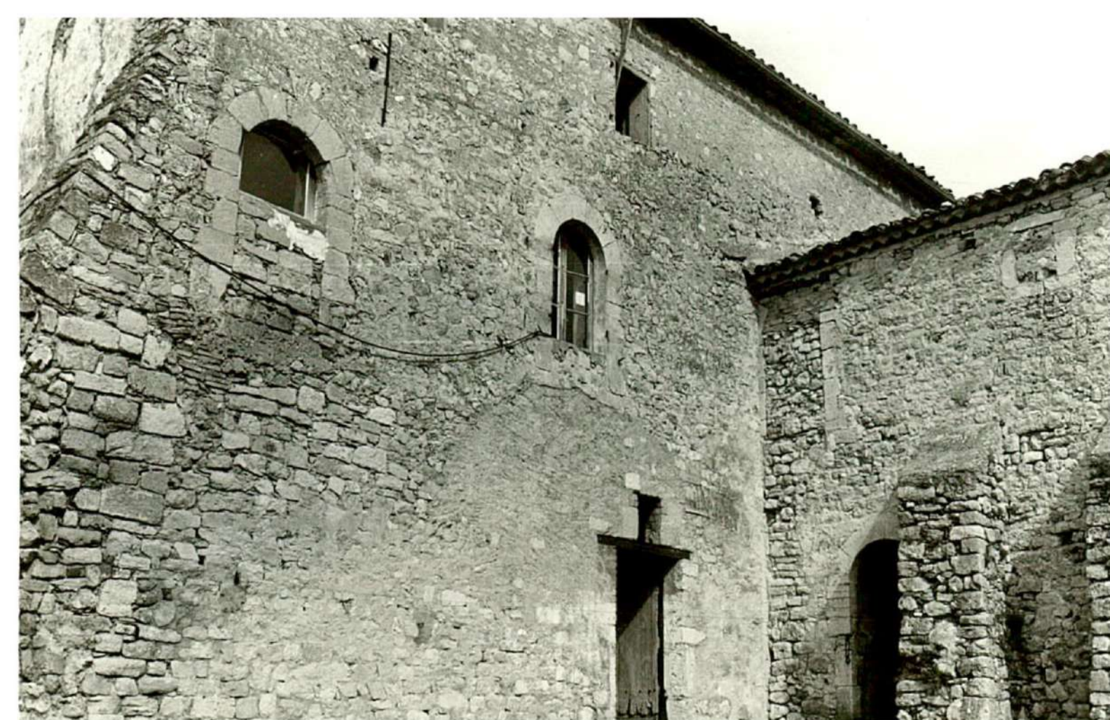
Vue 4 - Façade Sud (vers 1978)