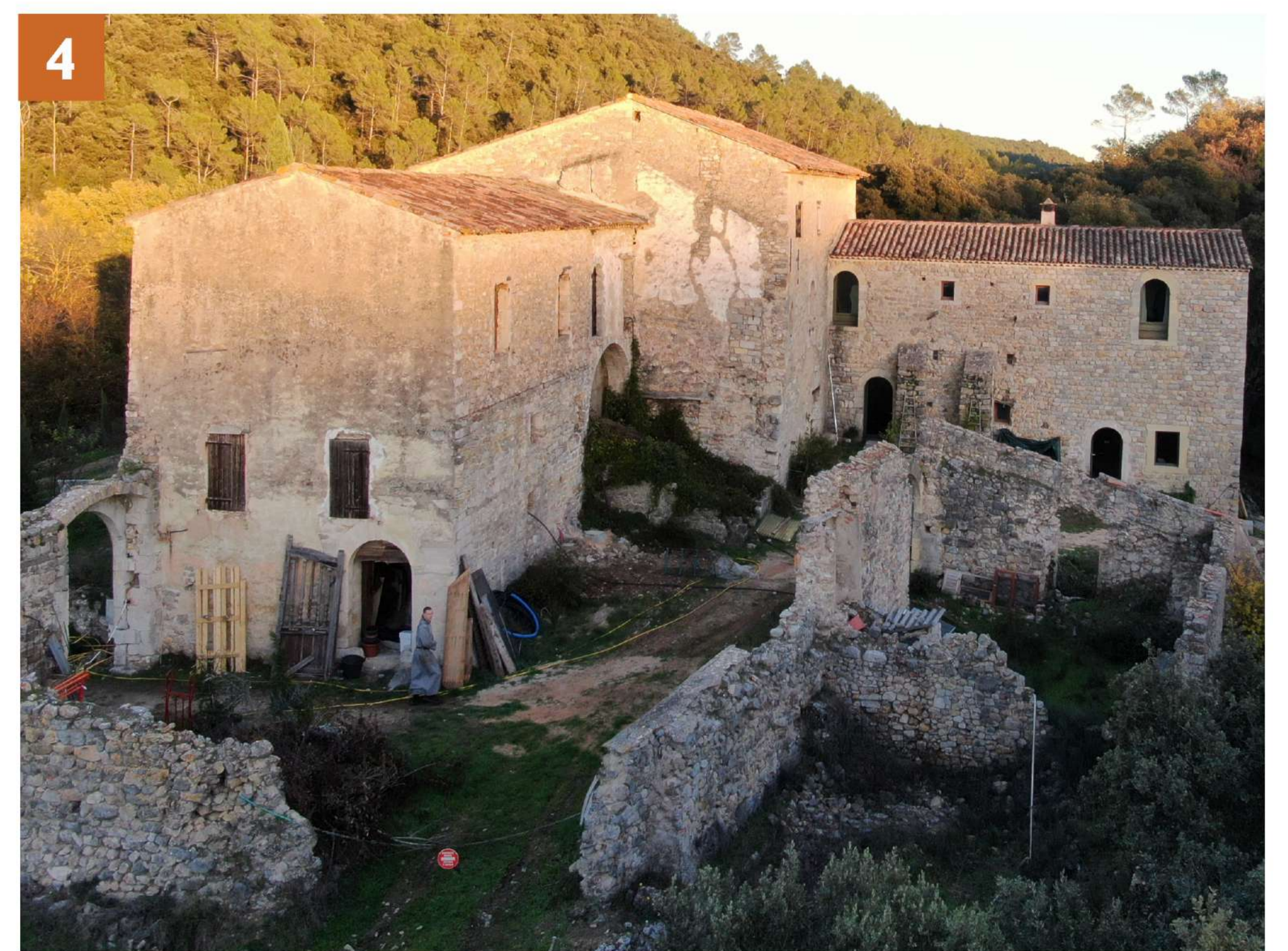
Vue 4 : La cour