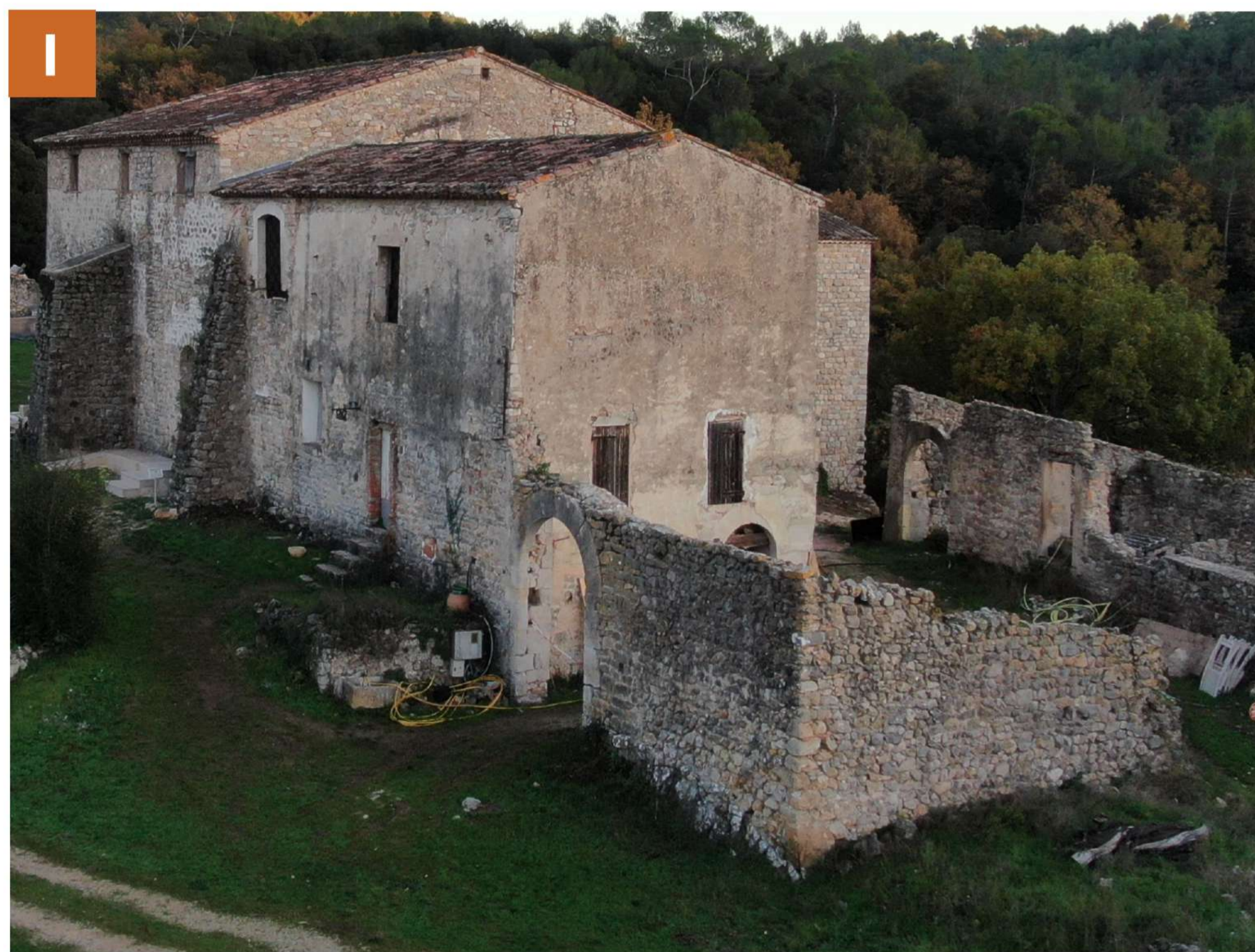
Vue 1 : Angle Nord-Ouest